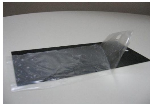
黒塗装板に塗布し乾燥後の皮膜状態