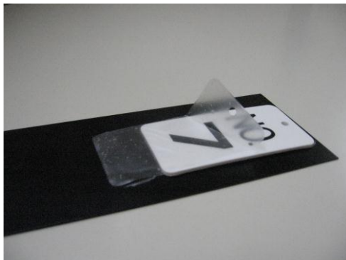
樹脂板に塗布し乾燥後の皮膜状態