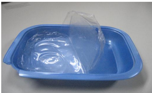
樹脂のトレイに塗布し乾燥後の皮膜状態